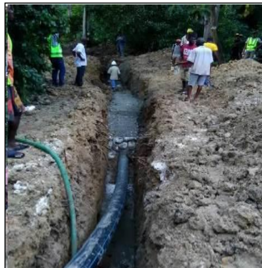
Foto 5 & 6.- Obras del proyecto de rehabilitación y extensión del sistema de agua potable de la ciudad de Miragoane (Detalle ejecución zanjas y pruebas de presión)