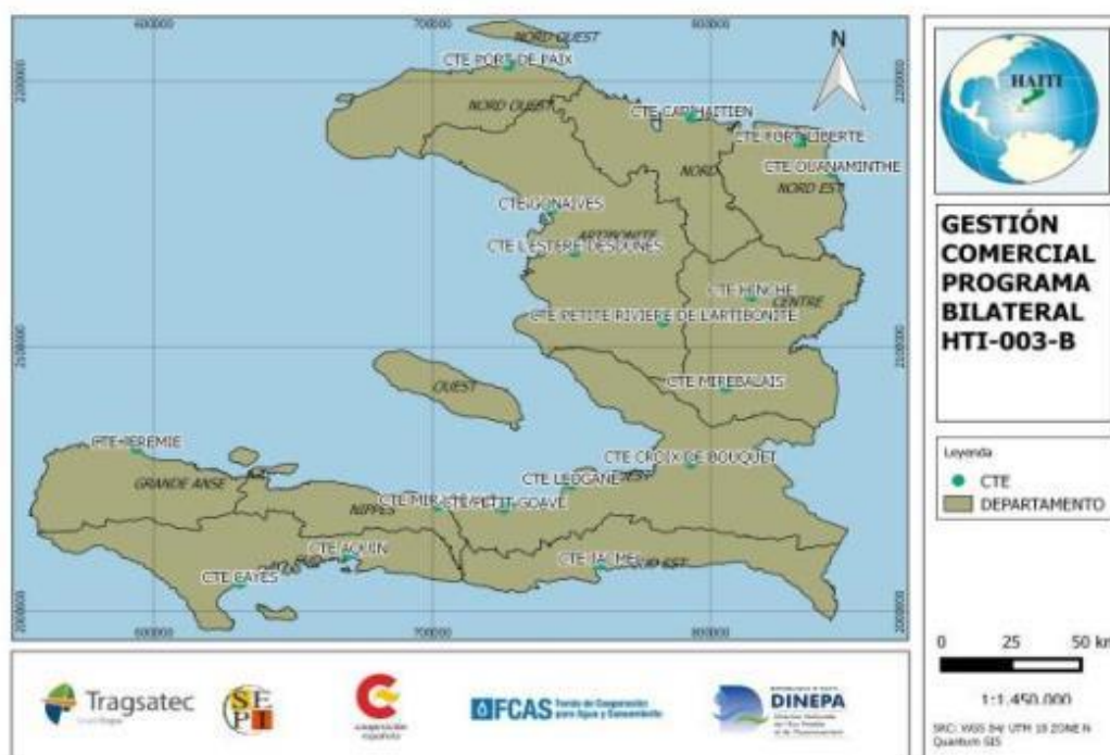
Figura 3.- Localización de los CTE en los que se apoyará la gestión comercial dentro del marco del programa bilateral del FCAS.

Además, con el fin de crear redes de conocimiento y colaboraciones técnicas con otros países de la zona del Caribe, la DINEPA ha alcanzado acuerdos con otras instituciones, como el Instituto Nacional de Recursos Hídricos Cubano, así como formar parte de la Asociación de Operadores de Agua del Caribe CARIWOP.