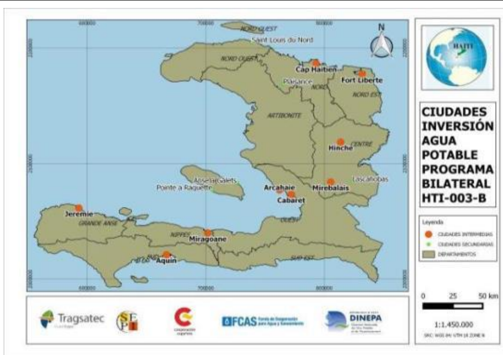
Figura 2.- Localización de las principales ciudades en las que se rehabilitarán y extenderán las infraestructuras de agua potable mediante las inversiones del programa bilateral del FCAS.

Saneamiento Urbano. El Programa se ha centrado en la mejora de la gestión de lodos procedentes de soluciones individuales. La rehabilitación y puesta en marcha de la planta de tratamiento de Titanyen servirá para tratar los lodos procedentes de soluciones individuales de la capital de Haití. Se debe recordar que Port-au-Prince, una ciudad de más de 3 millones de habitantes, no cuenta con servicios colectivos de saneamiento. Otra planta del mismo tipo está prevista en la localidad de Limonade, para tratar los lodos procedentes de Cabo Haitiano, la segunda ciudad del país. Existen otras dos plantas previstas en el POG 2017-2020 en las ciudades de Jérémie e Hinche, cuya realización dependerá de la disposición de terrenos y disponibilidad económica.