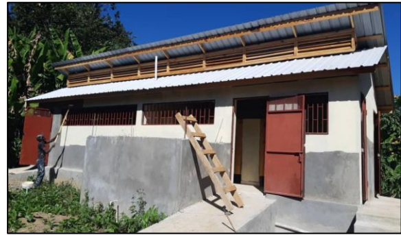
Fotos 1 & 2.- Bloques sanitarios construidos en las localidades de Perches y Vallieres