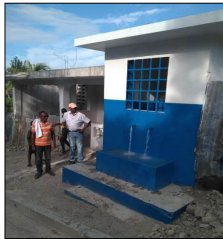
Fotos 3 & 4.- Obras del proyecto de rehabilitación y extensión del sistema de agua potable de la ciudad de Jeremie (Detalle obras y quiosco)